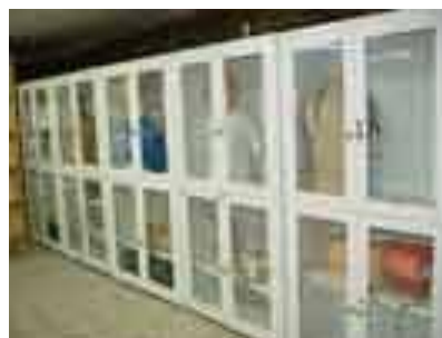
کارگاه مهارت‌های بالینی دانشکده

آدرس سایت پویای دانشکده پیراپزشکی : http://www.pmd.mshdiau.ac.ir