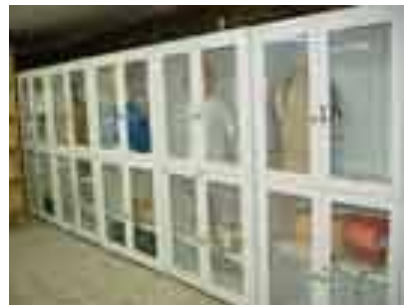
سالن مانکن پراتیک تخصصی دانشکده

آدرس سایت پوای دانشکده پیراپزشکی : http://www.pmd.mshdiau.ac.ir