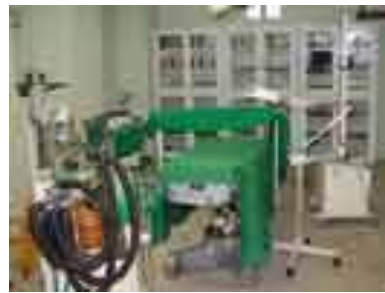
اتاق عمل پراتیک تخصصی دانشکده