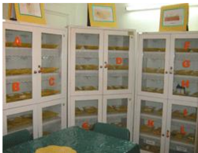
کارگاه فارماکولوژی دانشکده